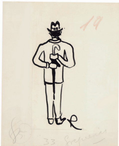
Ramón Gómez de la Serna, Greguerías, 3ª, Blanco y Negro, núm. 2.197, 23 de julio de 1933. Tinta y grafito sobre cartulina. Museo ABC, Madrid.

En la noche esos postes de telégrafo — reverso poético de su lado humorístico— parecen contadores de estrellas... La vaga luz de la luna los hace cuadros registradores de la cuenta estelar.