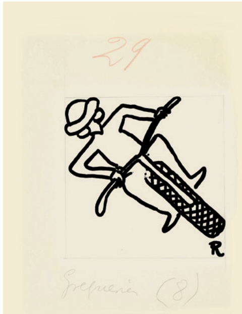
Ramón Gómez de la Serna, Greguerías, 5ª, Blanco y Negro, núm. 2.153, 18 de septiembre de 1932. Tinta y lápiz sobre cartón. Museo ABC, Madrid.

Hay caballos que nacen con piel de vaca, vergonzosa piel de vaca lechera, y siempre están como fuera de su destino siendo caballos. Se ve que deberían tener cuernos y que, por fin, cuando mueran, su piel será vendida como piel de vaca.