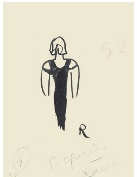
Ramón Gómez de la Serna, Greguerías, 6ª, Blanco y Negro, núm. 2.166, 18 de diciembre de 1932. Tinta y grafito sobre cartulina. Museo ABC, Madrid.

Hay unos fumadores que, más que fumadores, lo que son es meditadores de las pipas, desarmadores de boquillas y cachimbos, músicos que pulen mucho sus saxofones.