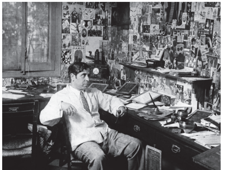
Ramón en su torreón de la calle Velázquez. Ca 1922-1930.

PARA MÁS INFORMACIÓN DE PRENSA, ENTREVISTAS O MATERIAL GRÁFICO