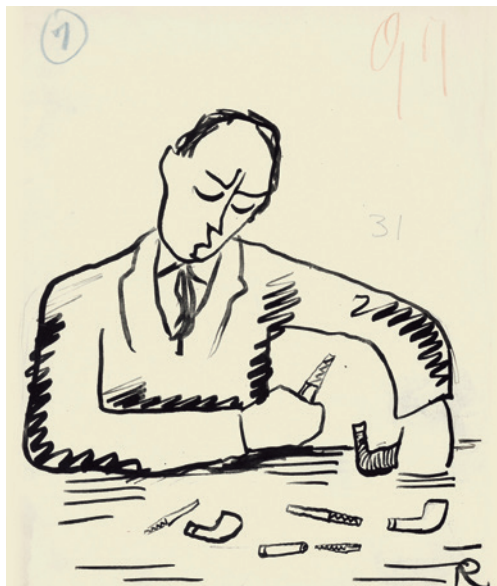
Ramón Gómez de la Serna, Greguerías, 7ª, Blanco y Negro, núm. 2.186, 7 de mayo de 1933. Tinta y grafito sobre cartulina. Museo ABC, Madrid.

Hay un caballero que oculta como un crimen su paraguas detrás de la espalda... Ese avergonzado de llevar paraguas tiene una hipocresía casi acrobática para disimular el artillugio ruborizador.