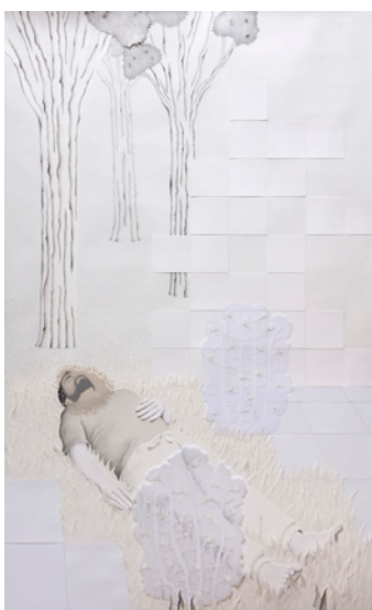
Guillermo Peñalver Ser tú 2019 Papeles recortados y grafito sobre papel, 195 x 120 cm