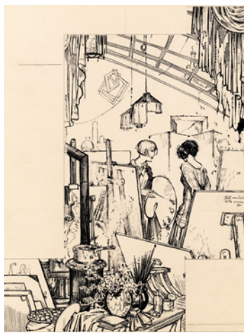
Emilio Ferrer Brigida y su boda, 1ª Blanco y Negro, núm. 1.972 3 de marzo de 1929 Tinta sobre cartón, 343 x 248 mm Museo ABC