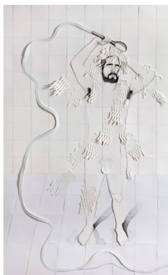
Guillermo Peñalver La ducha 2018 Papeles recortados y grafito sobre papel, 50 x 35 cm