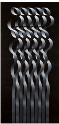
Julio Le Parc Modulación nº 66 1976 Acrílico sobre lienzo, 195 x 97 cm Colección Banco Santander