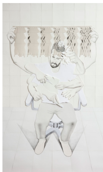
Guillermo Peñalver Yo dibujando 2019 Papeles recortados y grafito sobre papel, 195 x 120 cm