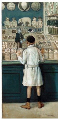
Ángel Díaz Huertas El niño y el escaparate Blanco y Negro, núm. 1.711 2 de marzo de 1924 Acuarela y tinta sobre papel, 323 x 222 mm Museo ABC