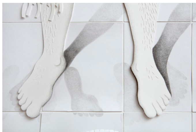
Guillermo Peñalver Detalle de La ducha