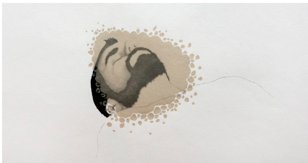
Guillermo Peñalver Máscara 2018 Papeles recortados y grafito sobre papel, 35 x 50 cm