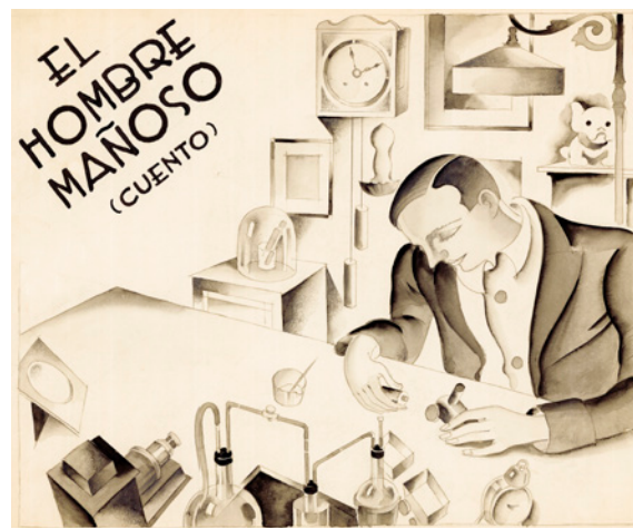
Antonio Barbero El hombre mañoso, 1ª ABC, núm. 9.050 24 de enero de 1932 Acuarela, grafito y tinta sobre papel, 316 x 407 mm Museo ABC